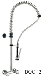
DOC - 2+