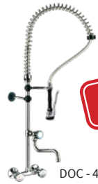
DOC - 4+