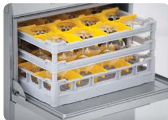
TT 50T ABT