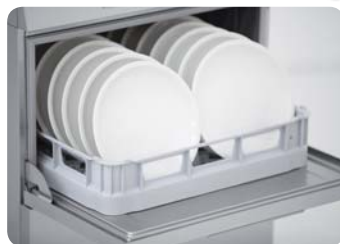
TT 50T ABT